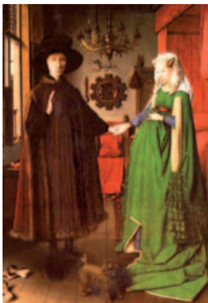
Jan van Eyck – Manželé Arnolfinioví (r. 1434). Grifonek jako symbol věrnosti.

I když městské obyvatelstvo zaujali grifonci svou přichylností, ostražitostí i zjevem, brzy začaly pokusy o posilování žádoucích znaků a potlačování těch ostatních. Plánovitý chov grifonka se datuje zhruba od roku 1880. V tomto roce získal na jedné výstavě konané v Bruselu grifonek titul Nejlepšího psa výstavy – a na světě byl bruselský grifonek. Titul znamenal zvýšený zájem o plemeno, navíc v sousedním Německu se dočasně zane-