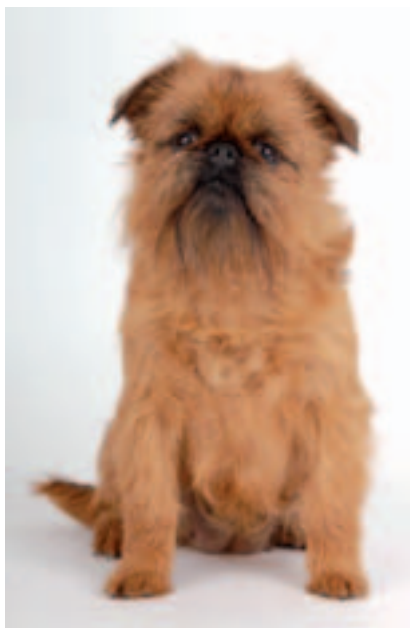
Bruselský grifonek (hrubosrstý červený) - Griffon Bruxellois F.C.I.-Standard č. 80