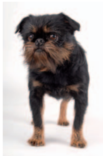
Belgický grifonek (hrubosrstý černý nebo černý s pálením) - Griffon Belge F.C.I.-Standard č. 81