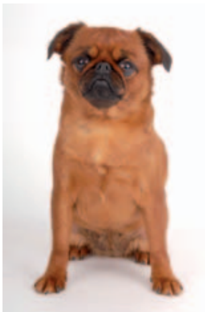
Brabantík (krátkosrstý červený, černý, nebo černý s pálením) - Petit Brabançon F.C.I.-Standard č. 82

Tři plemena známá také jako malí belgičtí psi mají nejen stejnou zemi původu – Belii, ale rovněž stejné předky; o tom svědčí i jejich vzájemná podoba.